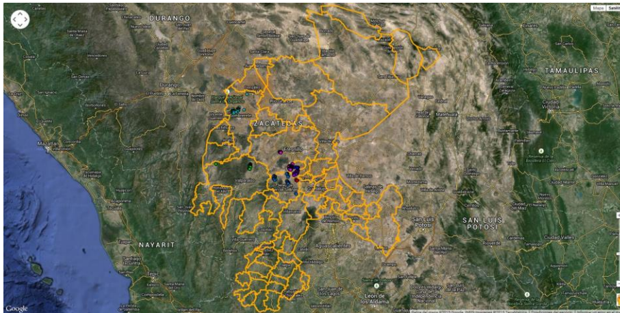
Distribución de Trampeo 2014 (Fuente: SICAFI, 2015).