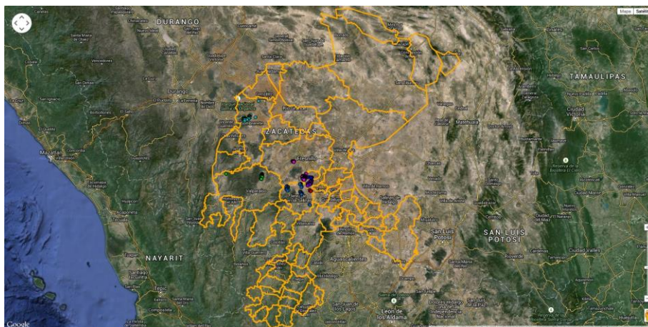
Distribución de Trampeo 2014 (Fuente: SICAFI, 2015).